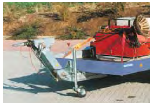
Zubehör: Höhenverstellbare Auflaufbremse, mit DIN-Zugöse, verstellbar von 400 bis 1100 mm Anhängerehöhe.