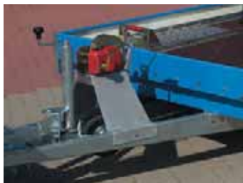
Zubehör: Seilwinde mit Windenbock und Verstellkeil auf Aluminium-Arretierblech.