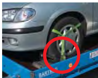
Zubehör: Verstellkeil auf Aluminium-Arretierblech.