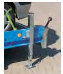
Zubehör: Teleskopstützen , mit Bolzen arretierbar, Feineinstellung mittels Kurbel, Tragkraft 1500 kg.