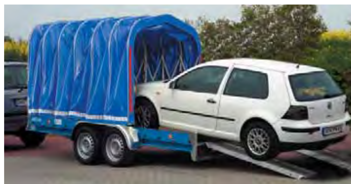
MZ 2702 mit Faltpavillon. Für die Fahrzeugverladung wird der Faltpavillon auf der Führungsschiene ganz nach vorne geschoben. Die Fahrzeugtüre kann geöffnet werden.