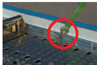
Optimale Verzerrung bei jeder Fahrzeuflänge durch