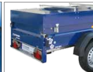
allseitig geschützte Multifunktionsleuchten / impact-proofed multifunctional rear lights