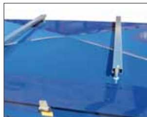
Vollverzinktes Trägersystem z.B. für Fahrradaufsatz / full galvanized rack system for example for bicycle transportation kit