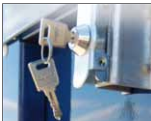
Metalldeckel mit 2 Sicherheitsschlössern / metal cover with 2 safety locks