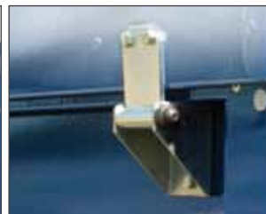
Stabiles Stahlscharnier für Metalldeckel / stable hinge belts for the metal cover