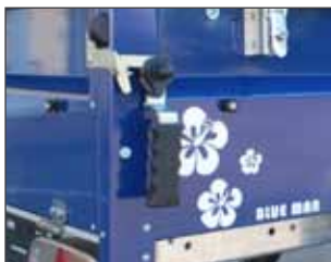
STEMA Sicherheitsverschluss (IMA getestet) / STEMA safety interlock (IMA proved)